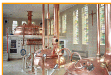
Calderes de macerat en un procés industrial.