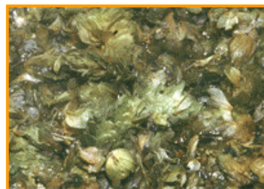
Cons de llúpols adicionats durant la cocció.

Un cop extrets els sucres cal bullir el most. En aquesta etapa s'afegeixen els llúpols i si la recepta ho requereix el sucre . Durant la cocció s'esterilitza el most i es solubilitzen les resines del llúpols que donen amargor i fragància a la cervesa. També en aquesta etapa es precipiten proteïnes que poden donar terbolesa a la cervesa. El most es bull durant uns 90 minuts, després dels quals és necessari filtrar-lo per separar-lo dels cons de llúpols esgotats.