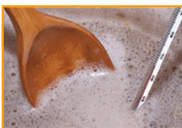
Control de la temperatura durant el macerat.